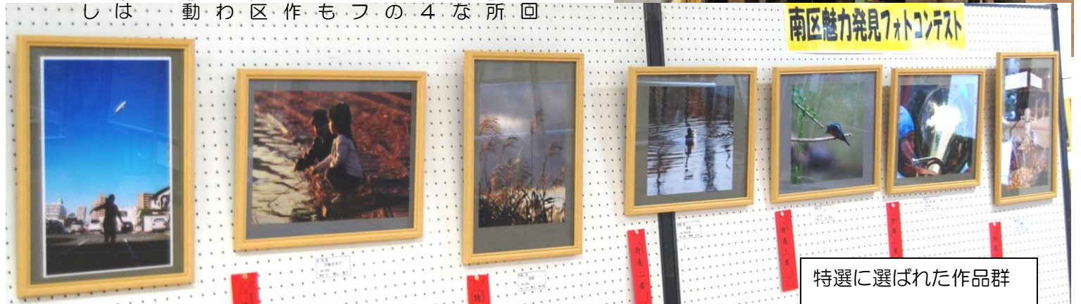
特選に選ばれた作品群